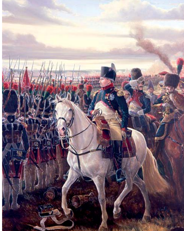
Napoleon în bătălia de la Friedland, 1807

care se face ceva fiind în el, ală cum este bronzul pentru statuie [și] argintul pentru cupă, ca [și] genurile acestora; iar în alt fel, cauza este forma [și] modelul, adică definiția a ceea ce este [și] genurile acestuia, ală cum este bunăoară, raportul lui doi față de unul în octavă [și], în general, numărul [și] părțile în definiție. În alt sens, cauza este lucrul din care pornește primul început al mișcării sau al repausului. Ală cum este cauză cel care propune o hotărâre [și] cum este tatăl pentru fiu [și], în general, cauză cum este cel care face lucrul făcut [și] cel care schimbă lucrul schimbat. Încă mai este scopul-cauză, adică lucrul pentru care se face ceva, cum este sănătaea cauză pentru plimbare. Căci pentru ce se plimbă? Zicem că se plimbă ca să fie sănătos [și] ală zicând socotim că ar fi cauza. Toate cauzele pe care le-am menționat într-o foarte vâdită, în patru clase. Dar de vreme ce există patru cauze, este datorită cercetătorului naturii să [și] despre toate [și] să reducă la toate întrebarea: de ce? [și] anume materia, forma, mișcarea [și] motivul”. 3