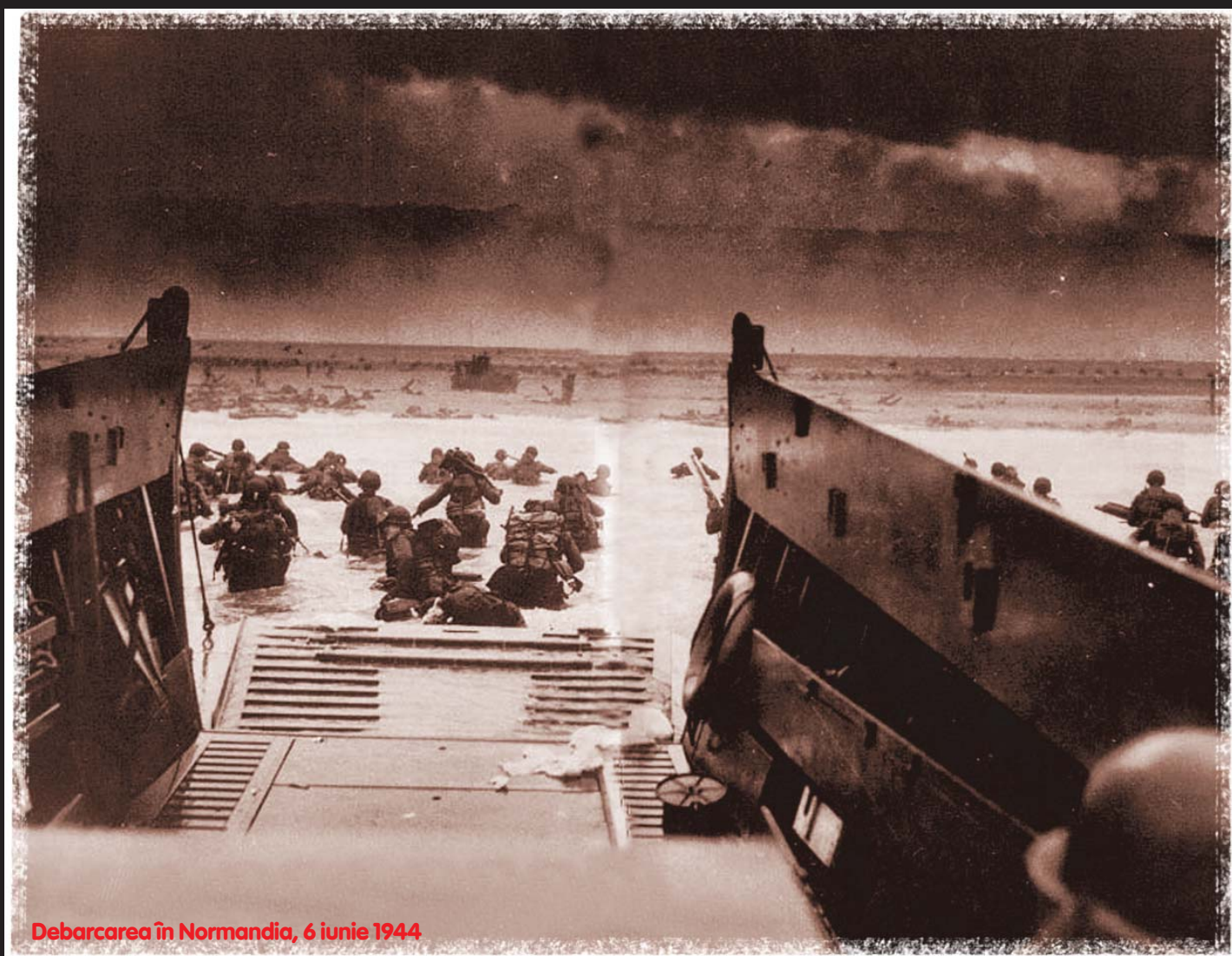
Debarcarea în Normandia, 6 iunie 1944

În consecință, cu toate că reflecția asupra apariției războaielor are o tradiție de câteva milenii, fiind la fel de veche precum războiul, până în prezent nici abordările empirice, nici cele științifice nu au avut ca rezultat dezvoltarea unei teorii unanim acceptate. Dimpotrivă, demersurile teoretice, mai mult