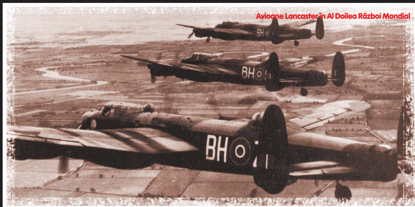
Avioane Lancaster în Al Doilea Război Mondial

îndeplinirea în prealabil a obiectivului militar, anume acela de a face adversarul neputincios. Finalitatea politică este dublată [și precedată așadar de una militară: „pentru a asigura acest obiectiv politic - n.n. trebuie