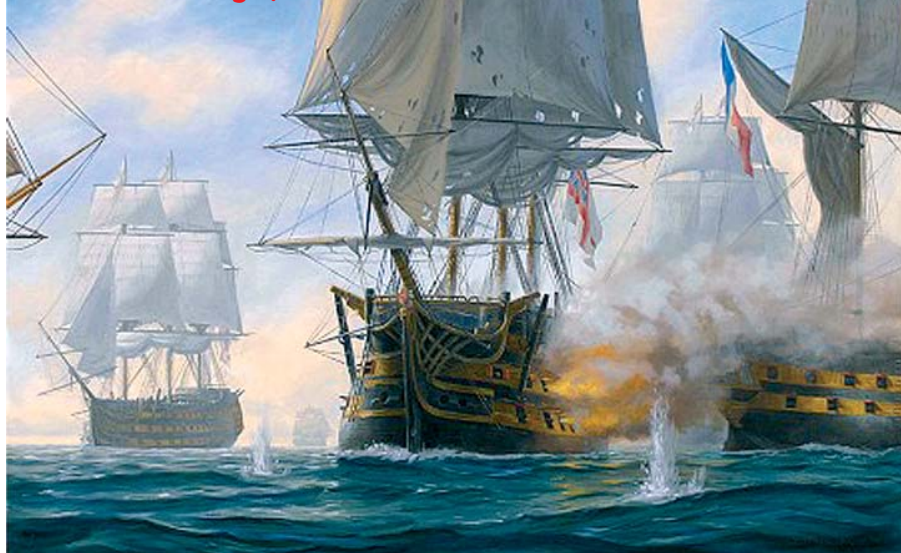
Bătălia de la Trafalgar, 21 octombrie 1805

Trecerea de la concepția încetănită în practica occidentală de a considera cauză tot ceea ce produce un efect la accepiunea împotriva acesteia nu ar reprezenta, alădar, decât o revenire la izvoarele cauzalității, ală cum a fost ea definită în opera lui Aristotel. În explicarea apariției și zboiului, acest demers poate însemna diferența între succes [și] eșec. Mai mult, neputința teoriilor precedente de a identifica un singur factor și spunzător pentru declanșarea tuturor și zboaielor sau, în cazul