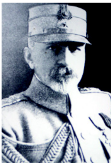
Mareșalul Presan Constantin

Dar ce exemplu mai bun ar putea fi adus în sprijinul celor afirmate mai sus, decât felul în care colonelul Otu prezintă, integrată în contextul mai larg al evoluțiilor