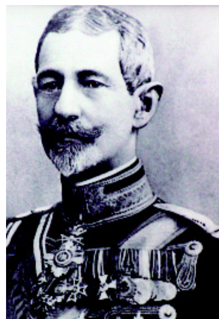
Mareșalul Alexandru Averescu