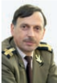
☞ Colonel Francisco STOICA

S-au spus multe despre Summitul NATO de la București. Punctele de vedere au dat savoarea acelor zile, ne-am pus întrebări, am încercat să ne dăm chiar singuri răspunsuri alunecând pe serpentinele informațiilor. Am trăit parcă altfel printre imaginile date de televiziuni. Personalități ale lumii au rămas în mintea noastră așa cum le-am văzut în capitala României.