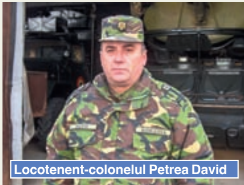
Locotenent-colonelul Petrea David

Înainte de a răspunde întrebării, trebuie amintit faptul că rândurile acestea nu au pretenția unei analize, ci doar constată. Aleși la întâmplare, soldații voluntari – pe care îi vom îngloba în continuare, pentru simplificarea exprimării, în