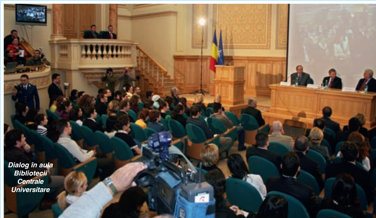
Dialog în aula Bibliotecii Centrale Universitare