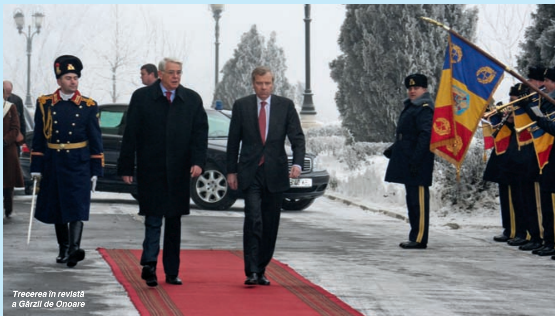
Trecerea în revistă a Gărzii de Onoare

Ministrul apărării i-a oferit secretarului general al NATO o sabie cu valoare de simbol din partea Armatei României.