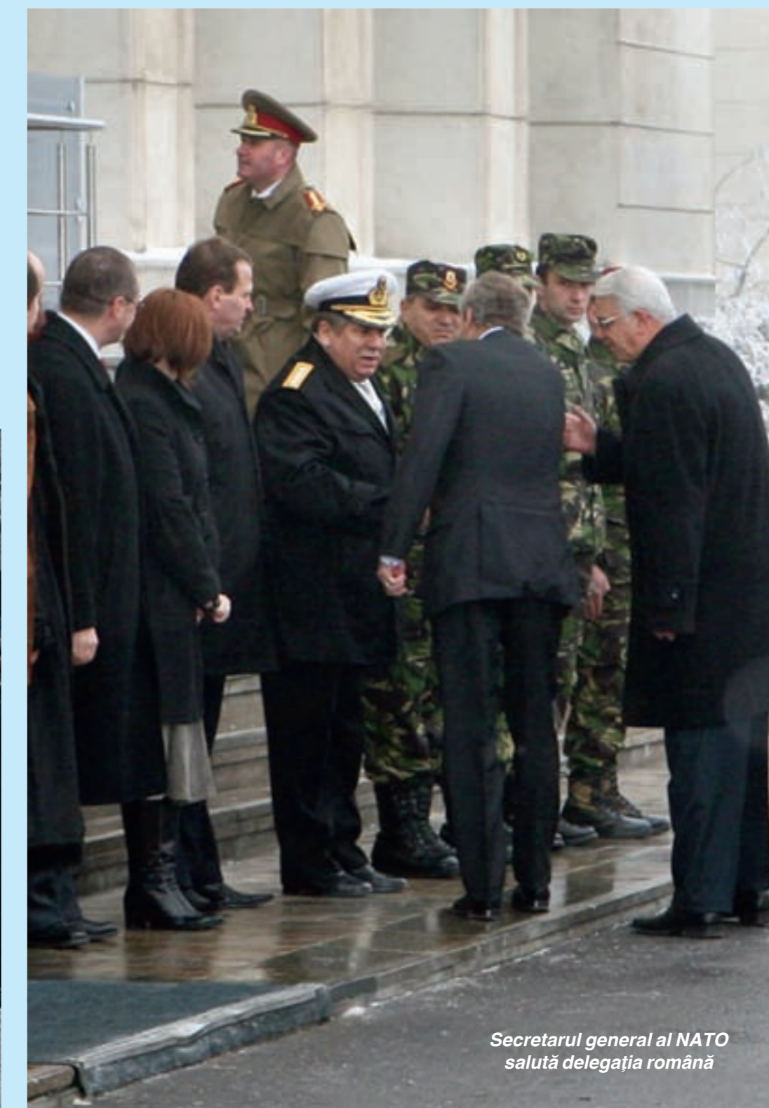
Secretarul general al NATO salută delegația română