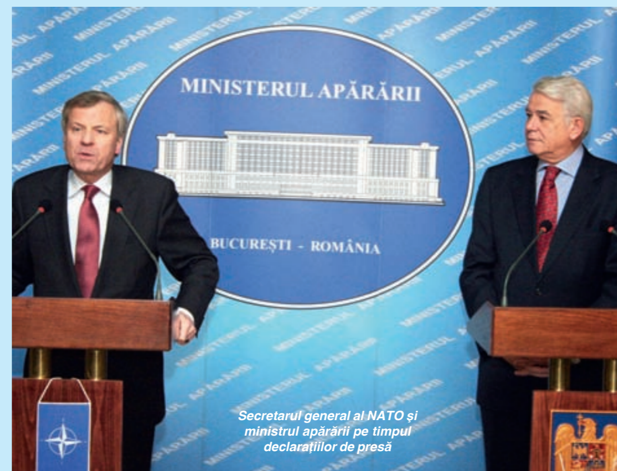
Secretarul general al NATO și ministrul apărării pe timpul declarațiilor de presă