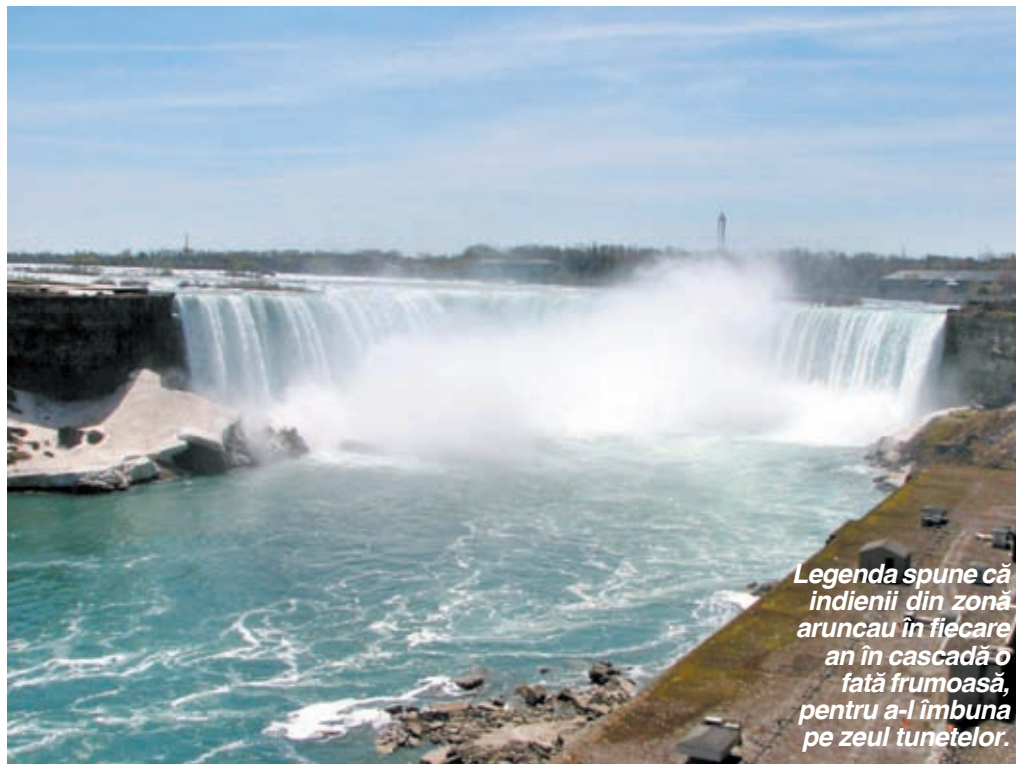
Legenda spune că indienii din zonă aruncau în fiecare an în cascadă o fată frumoasă, pentru a-l îmbuna pe zeul tunetelor.

Tower, din Toronto (cea mai înaltă construcție din lume), este locul de unde se pot admira în voie cele două cascade, americană și canadiană, de unde se poate avea o panoramă excelentă asupra orașului și de unde noaptea, când cascadele sunt iluminate în diferite culori, se