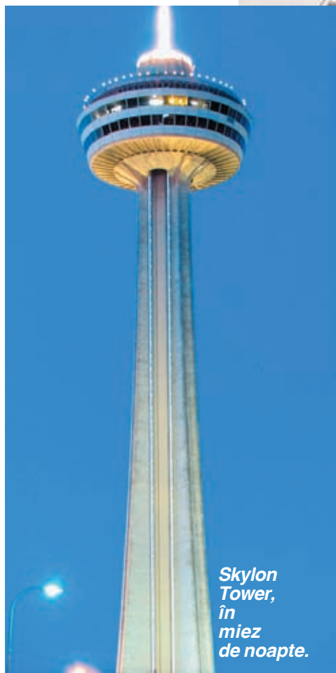
Skylon Tower, în miez de noapte.

copilul care pe vremuri nici nu-și imagina că există așa ceva pe lume.